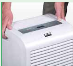
Wbudowane uchwyty i kółka transportowe