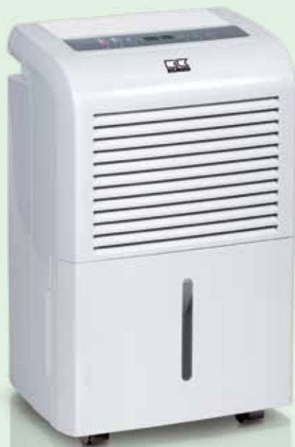
REMKO ETF 360

Niezawodne osuszanie powietrza, wydajniejsze niż słońce i wiatr