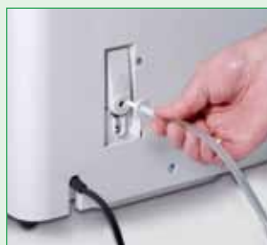
Wbudowana pompka skroplin