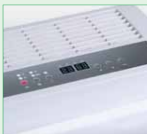
Czytelny panel sterowania